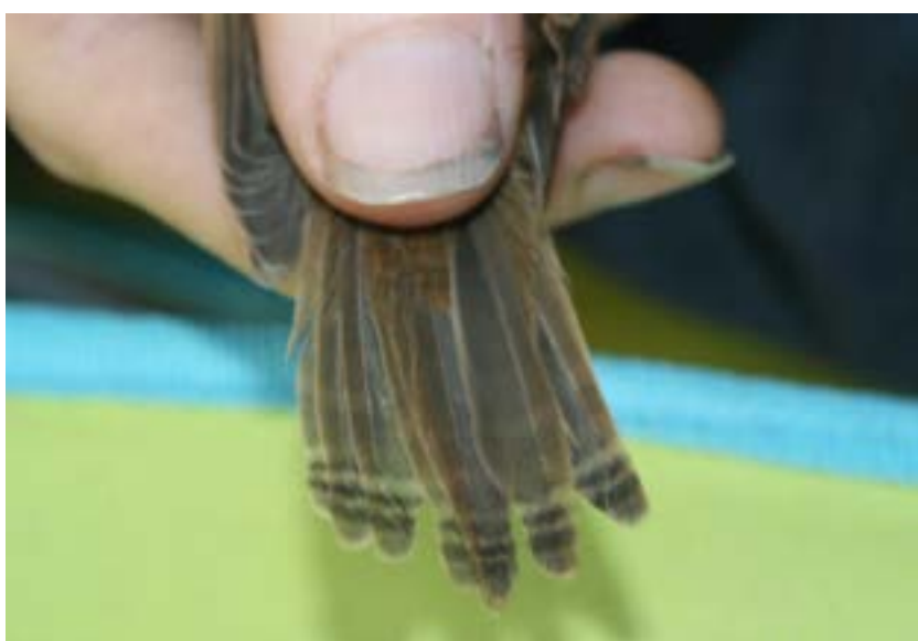
Figuur 1. Groeistrepen bij een jonge kleine karekiet.

Wat Oud Valkeveen betreft ziet het er naar uit dat tuinfluiters het zwaarst getroffen zijn. Dit seizoen zijn er 38 adulte tuinfluiters gevangen waarvan 16 vrouwtjes met actieve broedvlek. Aan het eind van het seizoen hebben wij slechts 11 jonge vogels kunnen ringen. Ook de zwartkop heeft het slecht gedaan met 77 adulte vogels en maar 32 jongen. Jonge zwartkoppen en tuinfluiters worden groot gebracht met rupsen en andere insecten die er nu helaas niet of nauwelijks meer zijn. Zwartkoppen en tuinfluiters maken hun nest in brandnetels en andere kruiden die dit jaar eveneens door de slagregens platgeslagen zijn.