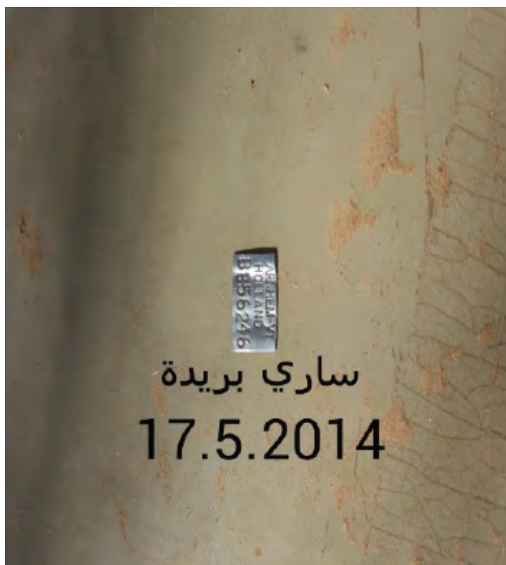
Figuur 1. Foto van de ring van de in Saoedi-Arabië geschoten kleine karekiet uit de Ooijse Graaf met de naam van de locatie in het Arabisch en de datum.

Minstens zo opmerkelijk als de terugmeldlocatie is het feit dat zowel de vogel uit de Ooijse Graaf als de vogel uit Zwarte Meer zo laat in het voorjaar nog doortrokken in Saoedi-Arabië en Koeweit. Midden mei lijkt erg laat voor een kleine karekiet van de ondersoort scirpaceus, maar voor de in Saoedi-Arabië en Koeweit gangbare ondersoort fuscus is het een typische datum (Pearson et al. 2002). Een belangrijke vraag is natuurlijk of beide vogels werkelijk kleine karekieten waren, en zo ja, van welke ondersoort? De kans is groter dat op deze oostelijke locaties bosrietzangers uit Nederland in plaats van