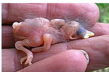
3 dagen. Begin tekening veren op vleugel. Code N1/N2.