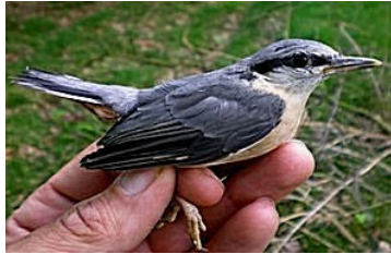
23 dagen. Uitvliegdag. Code N7.