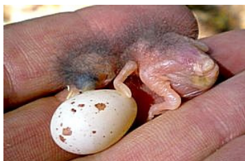
1 dag. Let op grootteverschil met evt. nog aanwezig ei. Code N1.