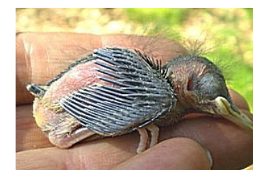
10 dagen. Begin van spruiten veer uit bloedspoel. Code N5.