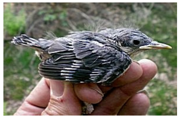
15 dagen. Let op lengte veer uit bloedspoel. Code N5.