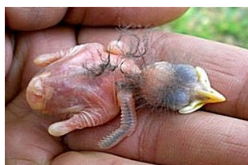
4 dagen. Verengroei op vleugel duidelijker. Code N1/N2.