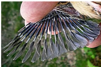
15 dagen. Let op lengte veer mondhoekplooi. Code N6.