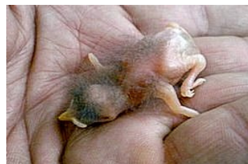
2 dagen. Slechts verschil in lichaams grootte. Code N1.