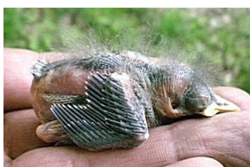
9 dagen. Let op lengte nu nog. gesloten bloedspoelen Code N5.