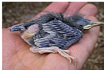
13 dagen. Let op lengte veer uit bloedspoel. Code N5.