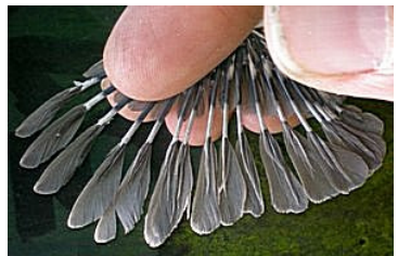
16 dagen. Slagpennen half volgroeid. Code N6.