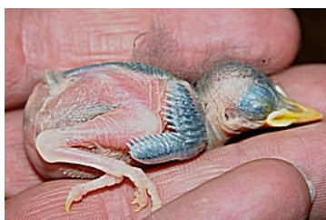
6 dagen. Slagpennen duidelijk in begin van pin. Code N4