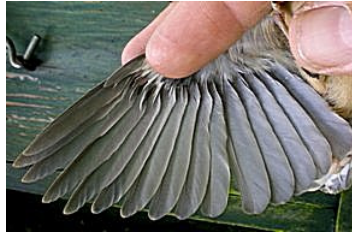
23 dagen. Uitvliegdag. Code N7.