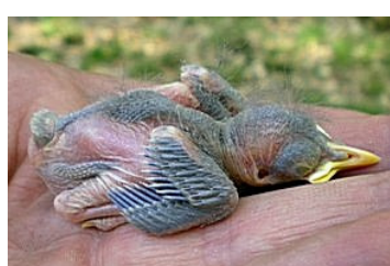
8 dagen. Kleine dekveren nu ook in begin van bloedspoel. Code N5