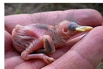
5 dagen. Aanzet van groei van de rugveren. Code N1/N2.