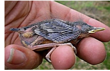
12 dagen. Let op lengte veer uit bloedspoel. Code N5.