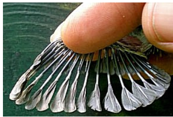
14 dagen. Let op lengte veer uit bloedspoel. Code N5.