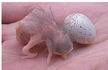
0 dag. Donkerrode huid. Code N0.