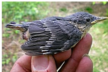
16 dagen. Slagpennen half mondhoekplooi. Code N6.