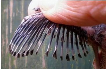
12 dagen. Let op lengte veer uit bloedspoel. Code N5.