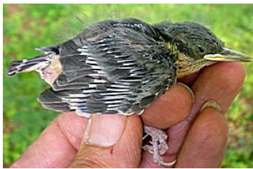
14 dagen. Let op lengte veer bloedspoel. Code N5.