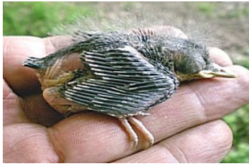
11 dagen. Let op lengte veer uit bloedspoel. Code N5.