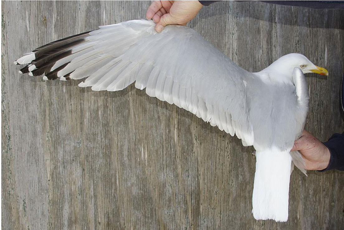
Foto: Bij bezoeken aan het Forteiland wordt er zoveel mogelijk van de gelegenheid gebruik gemaakt om het vleugelpatroon te documenteren zoals bij deze Zilvermeeuw tijdens een ringvangst.

Door middel van dit onderzoek hopen wij meer inzicht te krijgen over de herkenning van de verschillende soorten meeuwen en hun leeftijden binnen Europa.